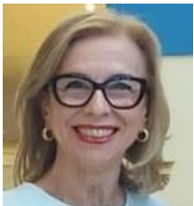
Mª Encarnación Rivas Díaz. Directora General de Ordenación del Territorio y Urbanismo. Xunta de Galicia