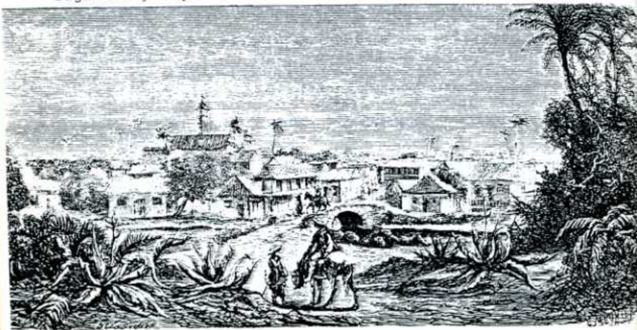
Vista de Cali

Este tipo de investigación sobre la percepción ambiental puede proporcionar material adecuado para optimizar la creación y diversificación de espacios ideales. Sin embargo, la coordinación de los aspectos físicos y humanos en el paisaje requiere un esfuerzo de investigación, coordinación y complementariedad entre especialistas de diferentes campos que facilite la comunicación y la cooperación entre paisajistas y especialistas de las ciencias humanas.