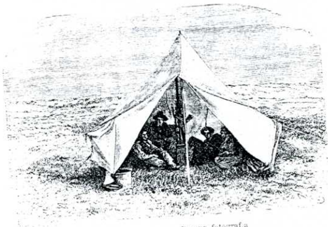
En el campamento. - De una fotografía

miento son un bagaje importante. E indica que ha fun cionado . Y ha funcionado bien. Pero no podemos olvi- dar que el COT ha evolucionado cada año. Se ha modi- ficado siempre teniendo en cuenta la demanda de los alumnos. Pues es muy importante la propia evaluación que los alumnos hacen del curso -tanto del profesoro- rado, como del Proyecto, de los tutores...- para funcionar en esta línea. Teniendo en cuenta qué ha fallado el curso pasado para modificarlo.