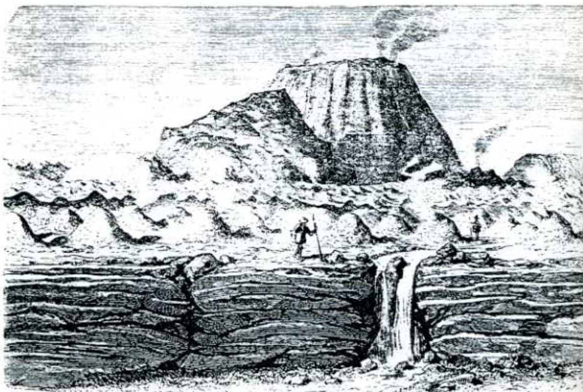
El Jorullo, volcan de Mexico