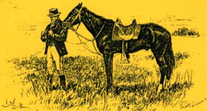
El entomólogo.—De una fotografía

ASOCIACION INTERPROFESIONAL DE ORDENACION DEL TERRITORIO