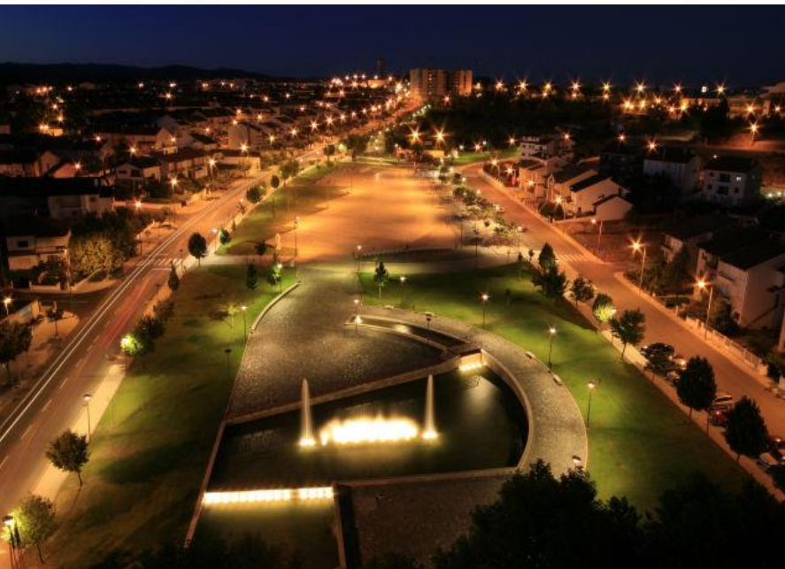
Plaza del eixo Atlantico en Bragança